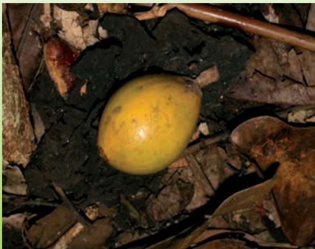
Fruit Pouteria multiflora , Pain d'épices

• Paysager : Paysage de sous bois unique en Martinique par la présence d'énormes blocs rocheux recouverts d'une luxuriante végétation de Figueiers ( Ficus nymphaeifolia ), d'Aracées, d'Orchidées et de Ptéridophytes.